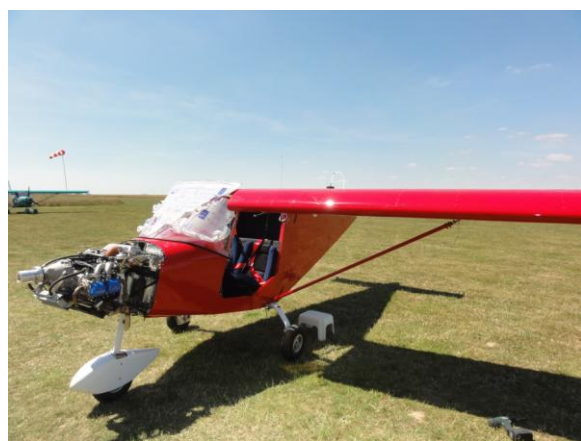
Mise en place de la demi aile GX