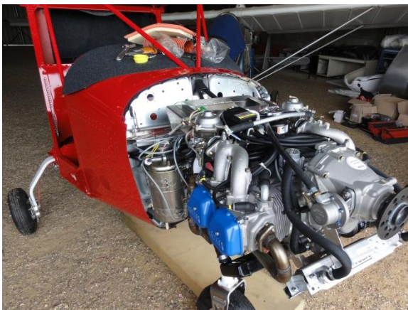
Montage de la partie moteur