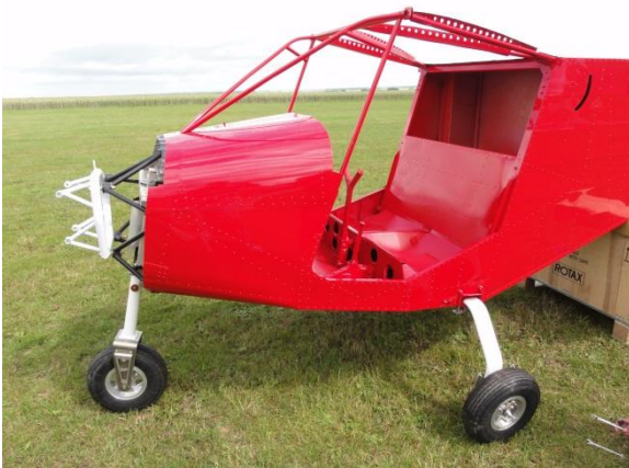
Montage du train et des roues