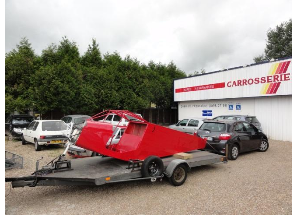
Mise en peinture du fuselage