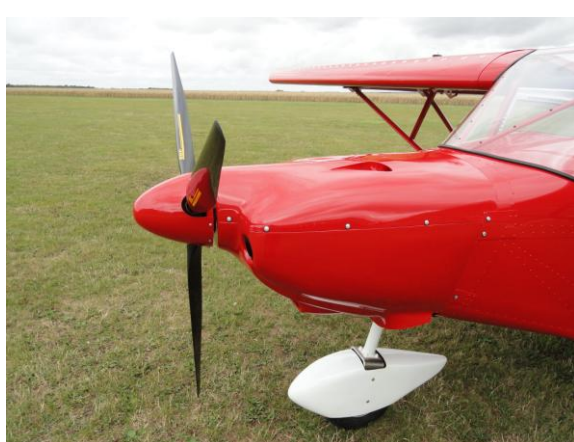
Mise en place du capot et cône