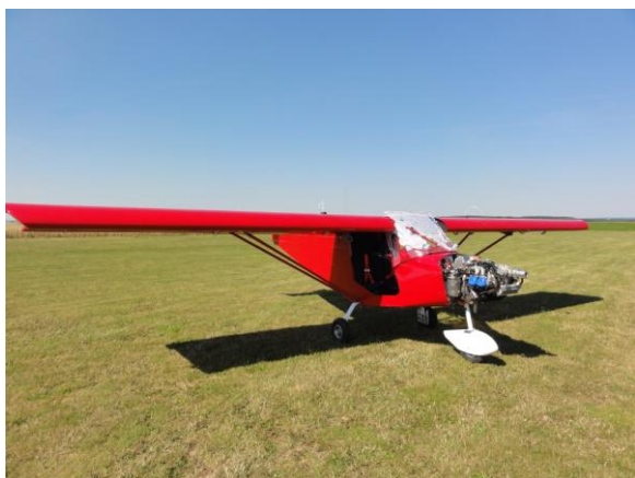
Mise en place de la demi aile DX