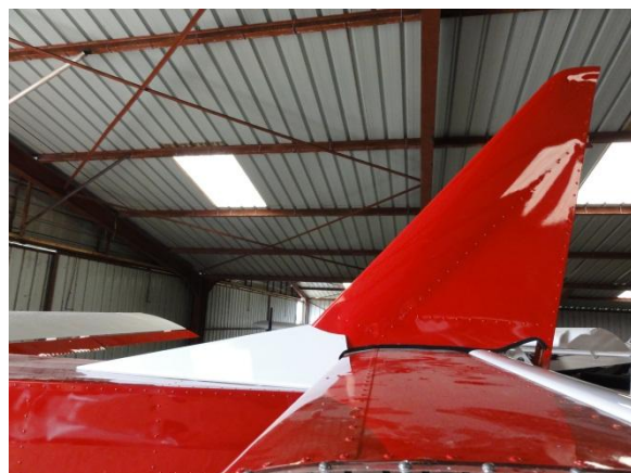
Mise en place de la dérive