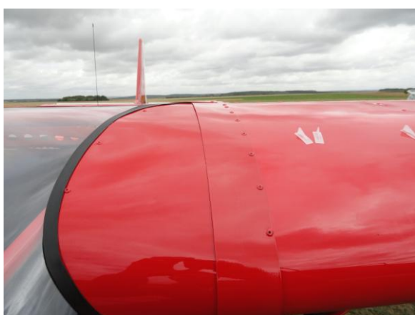
Mise en place des karmans