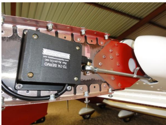
Mise en place du trim électrique