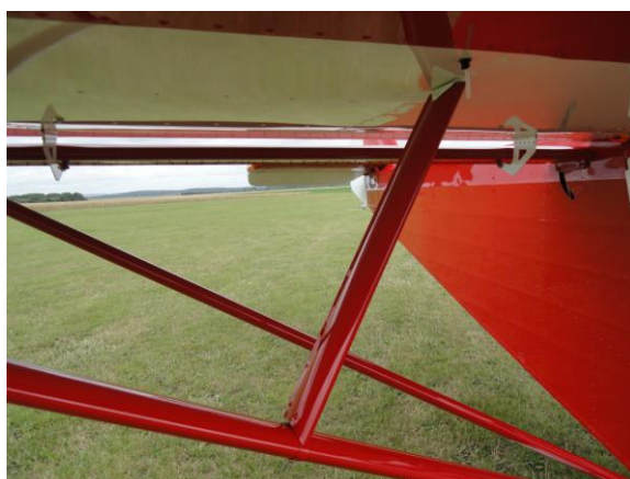
Mise en place des contre fiches