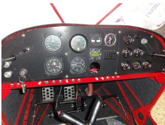
Installation du tableau de bord