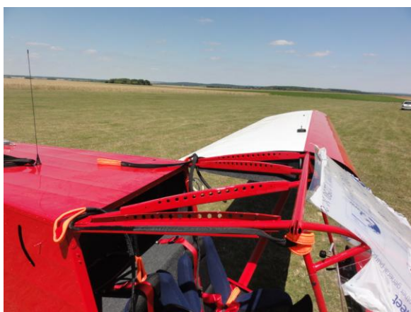
Passage des sangles du parachute