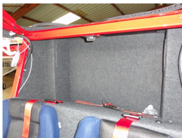
Installation de la moquette