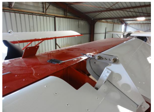
Installation de l'empennage