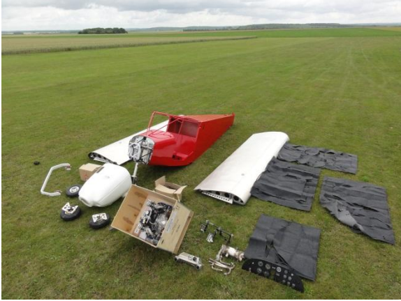
Réception du kit 4

Une construction rapide, facile et économique